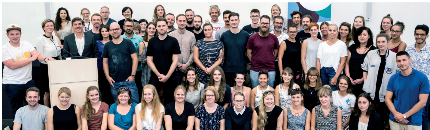
Das Weiterbildungsangebot des DMV und der IHM fand zum sechsten Mal im Vorfeld des Reeperbahn Festivals statt. Unser Foto zeigt die Absolventen 2018.

Schon zum sechsten Mal fand im Vorfeld des Reeperbahn Festivals in Hamburg die „Music Publishing Summer School“, das Weiterbildungsangebot des DMV in Zusammenarbeit mit der IHM (Interessengemeinschaft Hamburger Musikwirtschaft) statt.